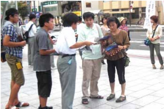
●近鉄奈良駅前行基さん前広場