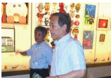
●富岡将人県教育長