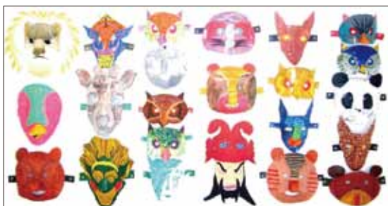
●「仮面」 高等養護学校3年生合同作品

いつも書いているキャラクターを主役に明るい未来のファンタジーをテーマとして描きました。自分の作品が展示されてよかった。嬉しかった。