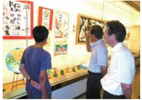
●富岡将人県教育長(中央)