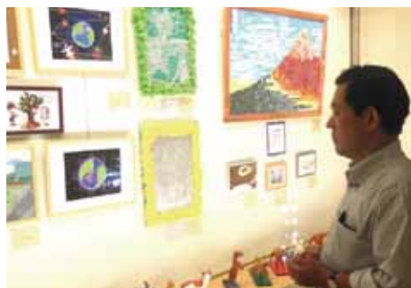
●上田清大和郡山市長