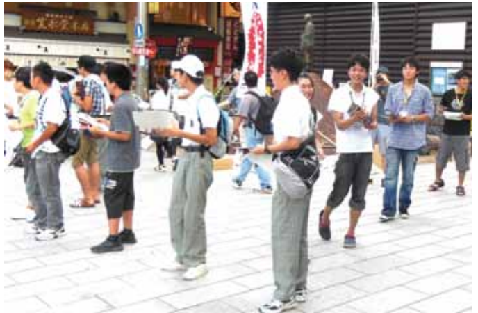
●生徒、卒業生と一緒にチラシ配布