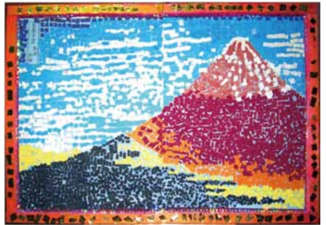
●「凱風快晴」(貼り絵) ・平成23年度奈良西養護学校高等部合同作品

2011年明日香養護学校文化祭「たちばな祭」のプログラムの表紙。高等部生徒全員がこのTシャツを着て文化祭に参加しました。