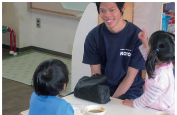
●奈良市立三笠保育園 ・11/6～8 ・奈良東養護学校高等養護部2年生 【実習】:保育補助