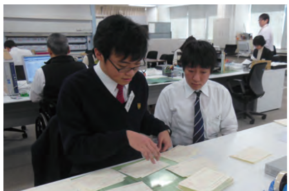
●三井住友銀行・SMBCグリーンサービス(株) ・高等養護学校3年生 ・12/20~26 【実習】:伝票整理、パソコン入力