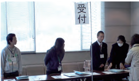
●宇陀市平和と人権を考える集い ・12月9日 ・宇陀市榛原文化センター ・受付：二階堂養護、高等養護学校生徒