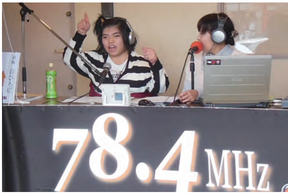
●ならどっとFM ・奈良養護学校高等部2年生 ・11/7 【実習】:ラジオ放送出演