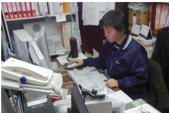
●済生会中和病院 ・高等養護学校3年生 ・12/5~7 【実習】:受付・事務補助