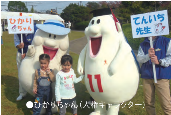
●ひかりちゃん(人権キャラクター)