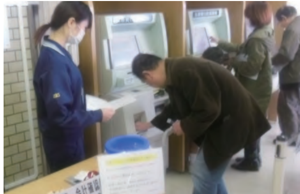
●大和高田市立病院 ・高等養護学校2年生 ・11/27~29 【実習】:受付、洗濯等