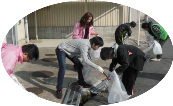
●奈良中央信用金庫 クリーンキャンペーン ・11月10日 ・王寺町島田地区 ・高等養護学校生徒2名、卒業生1名