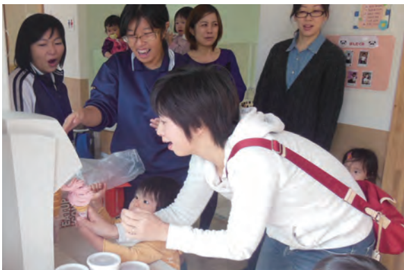
●奈良県立医科大学なかよし保育園 ・高等養護学校2年生 ・11/8～10 【実習】:保育補助