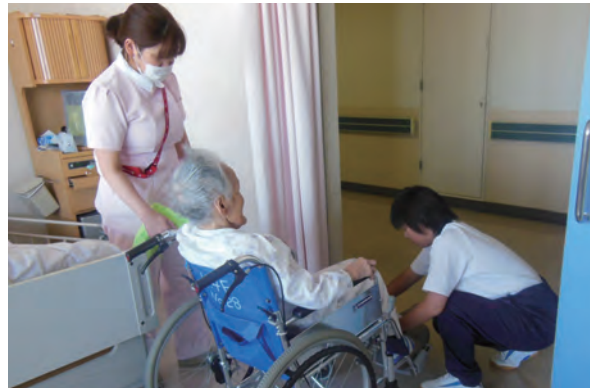
●済生会中和病院 ・高等養護学校3年生 ・10/23～25 【実習】:看護補助