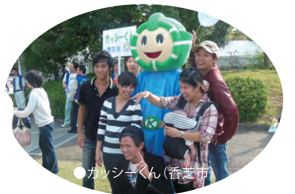
●カッシーくん(香芝市)