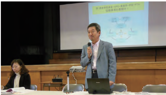
●第64回全国人権・同和教育研究大会 ・12月1日～2日 ・岡山県倉敷市 【活動報告】：NPO法人ならチャレンジド