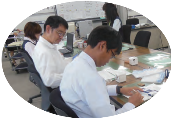
●三井住友銀行・SMBCグリーンサービス(株) ・高等養護学校3年生 ・10/9～15 【実習】:手形小切手帳印刷、発送