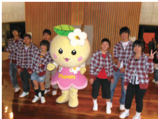
●よどりちゃんとダンス部生徒