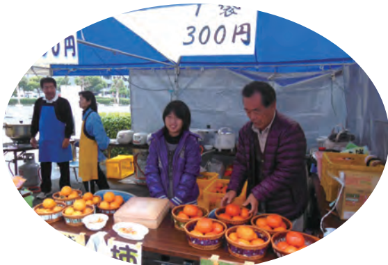
●大和高田市元気ウィーク ・高等養護学校2年生 ・11/17~18 【実習】:販売補助