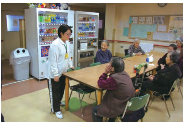
●奈良市和楽園 ・奈良養護学校3年生 ・10/29~11/2 12/10~14 【実習】:介護補助、清掃等