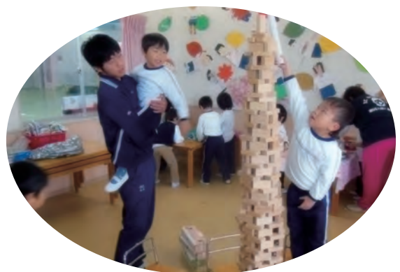
●三宅町三宅幼稚園 ・高等養護学校2年生・11/27～29 【実習】:保育補助