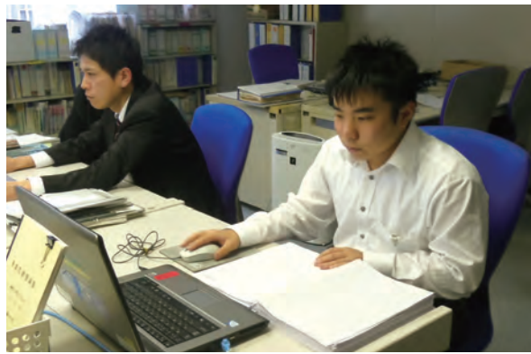
●関西電力奈良支店 ・11/7~9 ・奈良東養護学校高等養護部2年生 【実習】:事務補助