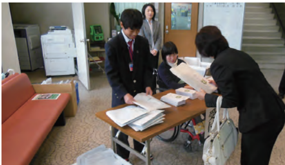
●平群町人権・命の尊さへの町民集会 ・11月17日 ・平群町中央公民館 ・受付：奈良養護、高等養護学校生徒