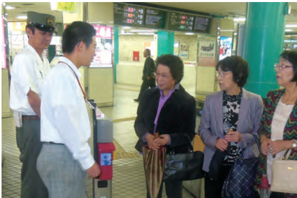
●近鉄奈良駅 ・高等養護学校2年生・10/16～18 【実習】:改札業務等