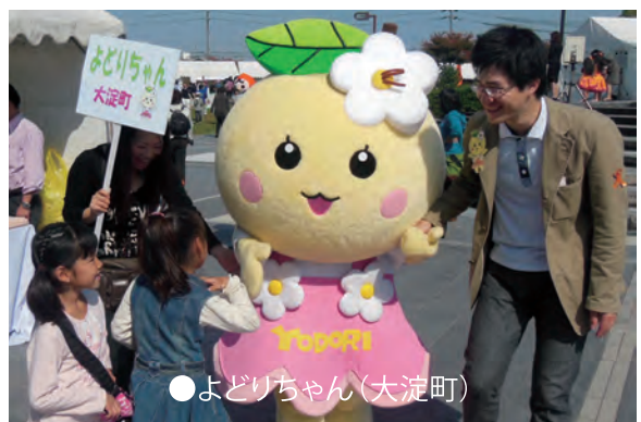
●よどりちゃん(大淀町)

特別支援学校生徒が受付および市町村のマスコット着ぐるみに入り、来場者と楽しく過ごしました。高等養護学校卒業生もボランティアにかけつけ、主催者スタッフとして活躍してくれました。奈良県・市町村職員のみなさま、ありがとうございます。