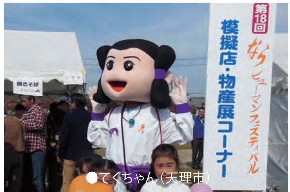
●てくちゃん(天理市)