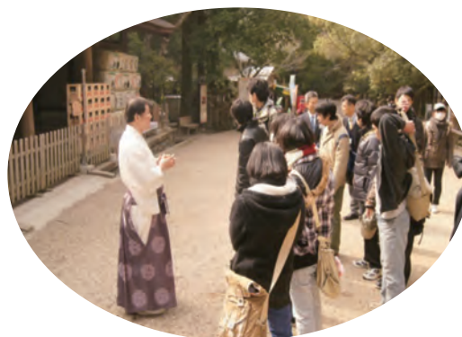
●奈良東養護学校 伝統文化を学ぶ ・2月26日 ・高等養護部2年生 【講師】春日大社欄宜