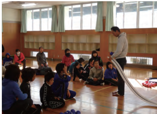
●奈良西養護学校 ボッチャ競技 ・1月27日(金) 【講師】ヒューマンヘリテージ株式会社