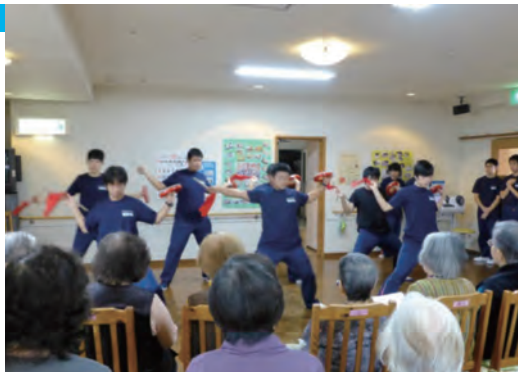
●奈良東養護学校 高齢者交流 ・11月30日 ・高等養護部3年生 【講師】トマトホーム職員