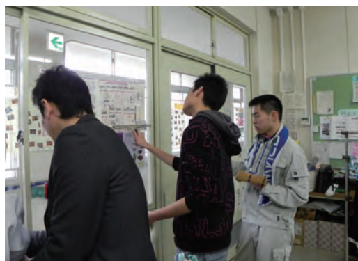
●西和養護学校 窓清掃 ・2月27日 ・高等部2年生8名 【講師】(社)奈良県ビルメンテナンス協会