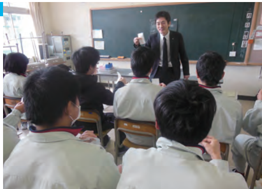
●奈良東養護学校 金融講習 ・1月23日 ・高等養護部・病弱部3年生 【講師】南都銀行職員