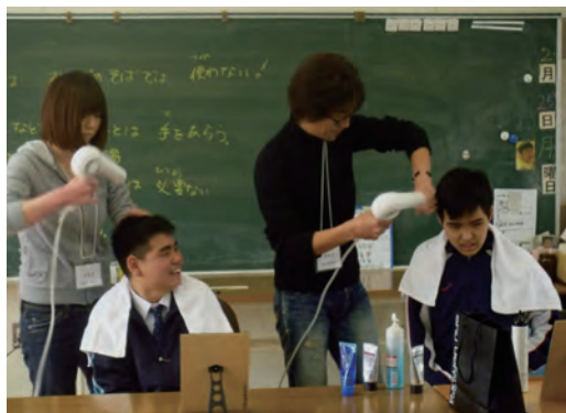
●奈良西養護学校 美容講座 ・2月25日 ・高等部3年生 【講師】美容室APEX