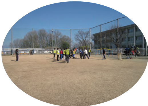
●奈良西養護学校 サッカー ・1月31日 ・高等部 【講師】NPO法人奈良クラブ