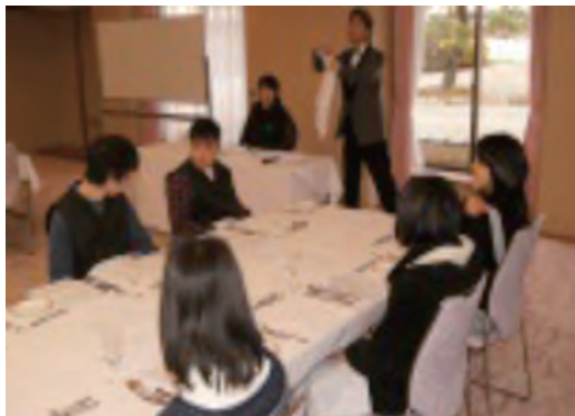
●奈良東養護学校 マナー講習 ・2月26日 ・高等養護部2年生 【講師】春日野荘職員