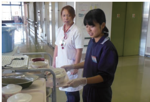
●奈良県総合リハビリテーションセンター (11/26~28) ・高等養護学校2年生 【実習】看護補助