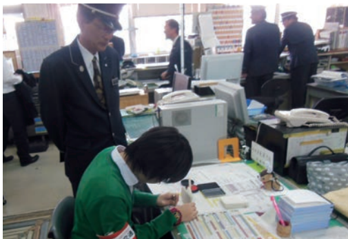
●奈良交通株式会社 (11/19～22) ・奈良東養護学校高等養護部2年生 【実習】接客、事務補助、チラシ吊り、野菜栽培等