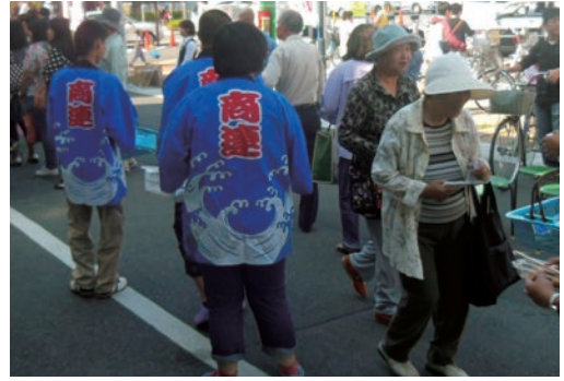
●高田おかげ祭り (10/14) ・高等養護学校1年生4名 【主催】大和高田市商業者組織連合会