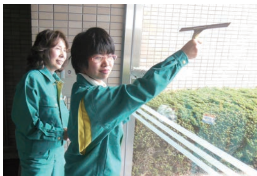
●株式会社シティサービス (12/2~6) ・奈良県立教育研究所・高等養護学校2年生 【実習】清掃