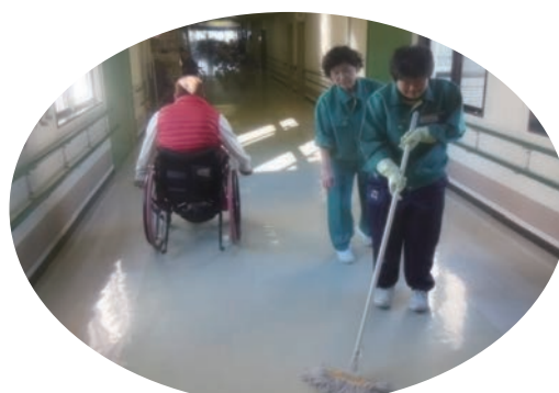
●株式会社シティサービス (12/2~6) ・奈良県総合リハビリテーションセンター ・高等養護学校2年生 【実習】清掃