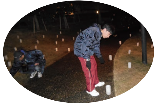
●香芝冬彩 (12/21) ・香芝市役所隣・今池親水公園 ・西和養護学校5名、高等養護学校5名 【主催】香芝冬彩実行員会(事務局:香芝市)