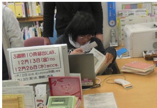
●平群町立図書館 (12/9) ・奈良養護学校2年生 【実習】カウンター業務