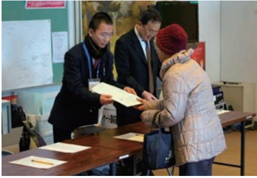
●宇陀市平和と人権を考える集い (12/7) ・宇陀市中央公民館菟田野分館 ・高等養護学校 【主催】宇陀市・宇陀市教育委員会