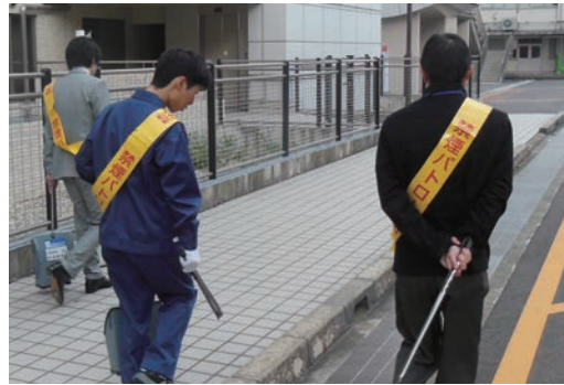
●奈良県立医科大学 (11/11～15) ・高等養護学校3年生2名