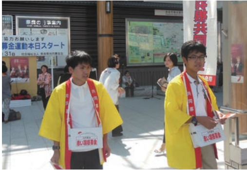
●共同募金運動 (10/1) ・近鉄奈良駅・奈良東、奈良西、高等養護学校6名 【主催】奈良県共同募金会・奈良市共同募金会