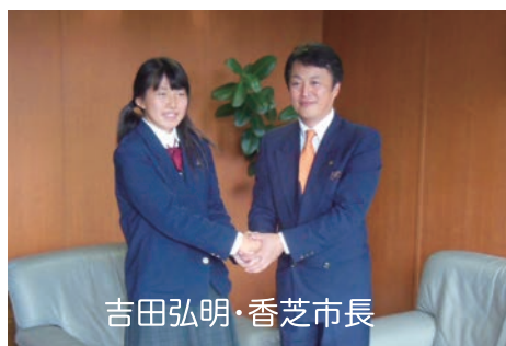
吉田弘明・香芝市長