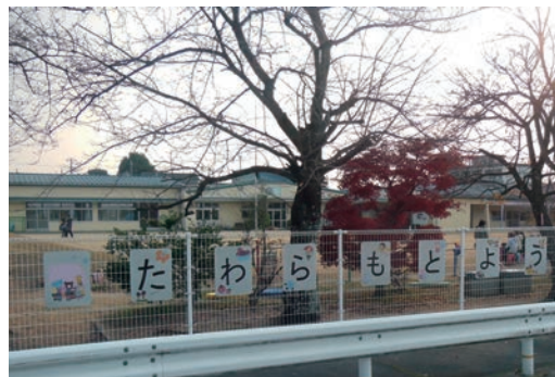
●田原本町立田原本幼稚園 (11/26～28) ・高等養護学校2年生 【実習】保育補助(3歳児)