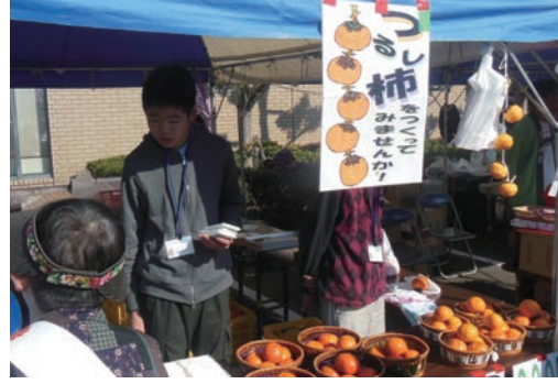
●やまとただ元気ウィーク (11/16~17) ・奈良県産業会館前広場 ・高等養護学校1年生6名 【主催】大和高田市