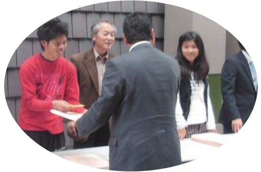
●第46回奈良県人権教育推進協議会研究大会 (11/9) ・なら100年会館 ・奈良東養護学校2名、高等養護学校生1名