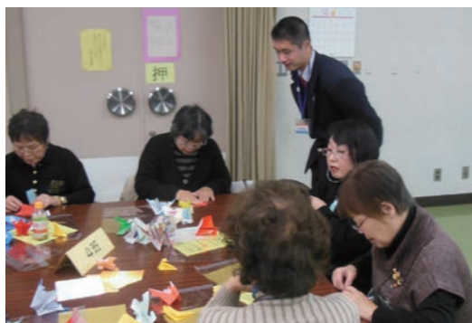
●奈良市京西公民館 (12/4~6) ・高等養護学校2年生 【実習】清掃、パソコン、事務、事業補助等