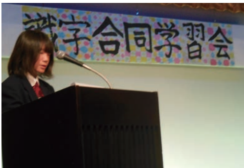
●識字合同学習会 (12/14) ・広陵町中央公民館 【司会】高等養護学校1年生2名 【受付】西和養護学校1年生2名 ◎主催:奈良県教育委員会 ◎共催:奈良県人権教育推進協議会