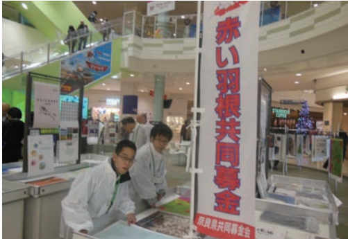
●歳末たすけあいカレンダーチャリティバザー展 (12/16~20) イオンモール高の原、大和郡山、橿原 ・奈良養護学校2名、奈良西養護学校2名 奈良東養護学校2名、高等養護学校9名 【主催】奈良県共同募金会