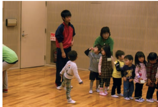
●奈良市音声館 (11/20～22) ・奈良東養護学校高等養護部2年生 【実習】音楽教室補助、事務・印刷補助等