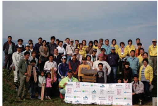
●第3回大淀町植樹祭 (11/2) ・大淀町平畑運動公園植樹地 ・高等養護学校2名 【主催】大淀町、奈良県森林組合連合会 JAならけん、ならコープ