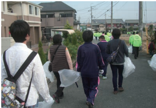
●奈良中央信用金庫クリーンキャンペーン (11/2) ・西和養護、高等養護学校生徒4名 ・香芝市内