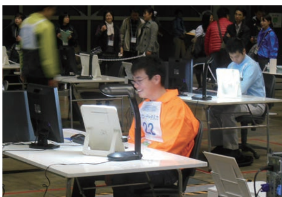
●A選手(パソコンデータ入力)

7月10日に開催されたアビリンピック奈良大会で金賞(知事賞)に輝いた奈良県代表選手5名は、第34回アビリンピックへ出場し、日頃鍛えた力を出し切り健闘しました。