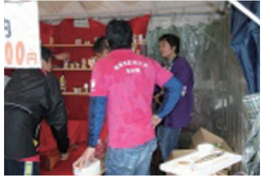
●たわらもと十六市 (10/20) ・津島神社 ・高等養護学校1年生3名 【主催】田原本町商工会青年部