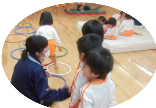
●社会福祉法人愛和会・宮森保育園 (11/25～29) ・高等養護学校2年生 【実習】保育補助(3歳児)