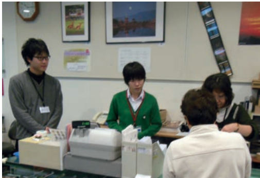
●奈良市写真美術館 (11/16～17) ・奈良東養護学校高等養護部2年生 【実習】受付、販売補助、喫茶サービス等