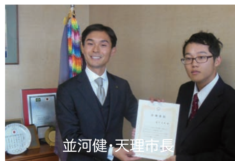
並河健・天理市長