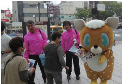
●振り込め詐欺防止キャンペーン (10/15) ・近鉄奈良駅行基広場 ・着ぐるみ「シカの白ちゃん」:野の花舎メンバー *奈良市三条通ショッピングモール役員さんと参加