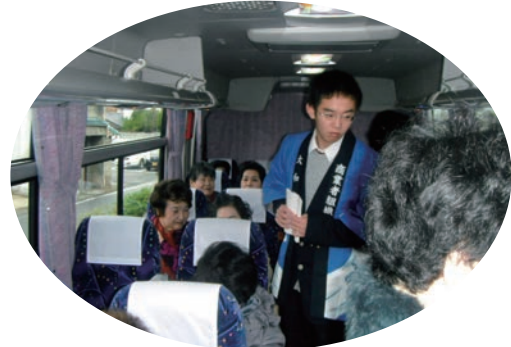
●大和高田市事業者組織連合会 (11/19) ・高等養護学校3年生2名 【実習】バス添乗(日帰り旅行)