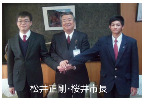
松井正剛・桜井市長