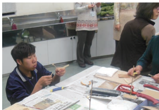
●奈良市生涯学習センター (12/19~21) ・高等養護学校2年生 【実習】事業補助(クリスマス会、竹細工等)