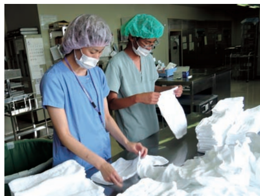
●国保中央病院 6/15～19 ・高等養護学校2年生(右)【実習】洗濯補助