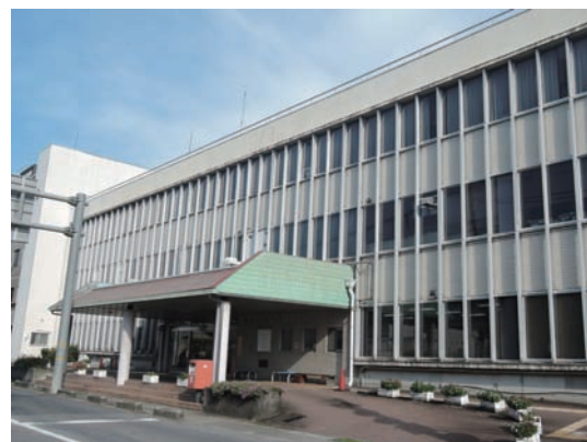
●大淀町立大淀病院 6/29～7/3 ・高等養護学校2年生 【実習】看護補助