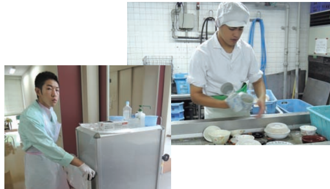
●天理よろづ相談所病院、白川分院 6/15～19、8/17～28 ・高等養護学校3年生【実習】看護補助、配送業務、食器洗浄