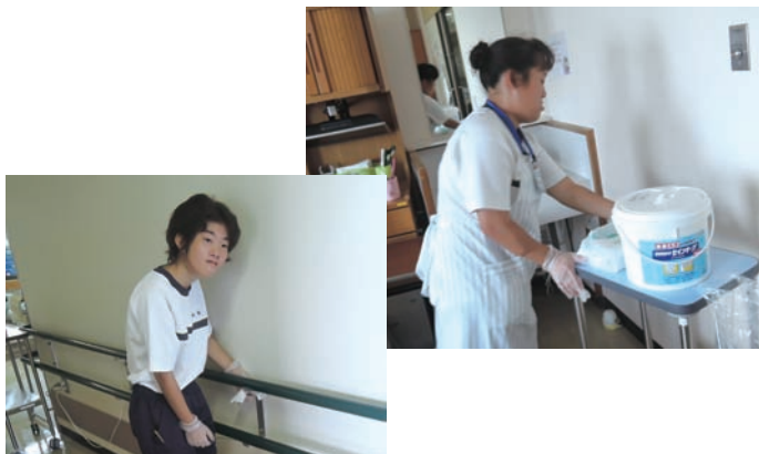
●奈良県総合リハビリセンター 6/8～12、7/21～31 ・高等養護学校3年生 【実習】看護補助 8/24～28