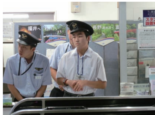
●JR奈良駅 8/26~27 ・奈良東養護学校2年生 【実習】改札補助