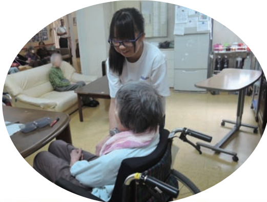
●社会福祉法人万葉福祉会 万葉苑 5/18~22 ・奈良東養護学校3年生【実習】介護補助 7/20~31