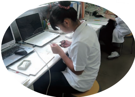
●奈良県総合医療センター 6/22～28、8/24～31 ・奈良東養護学校3年生 【実習】事務補助