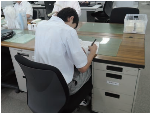
●三井住友銀行・SMBCグリーンサービス(株) ・高等養護学校2年生 【実習】事務補助 7/3~9