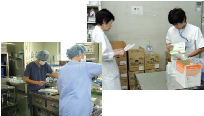
●奈良県西和医療センター 6/15～19、8/17～28 ・高等養護学校3年生【実習】薬剤部補助、看護補助