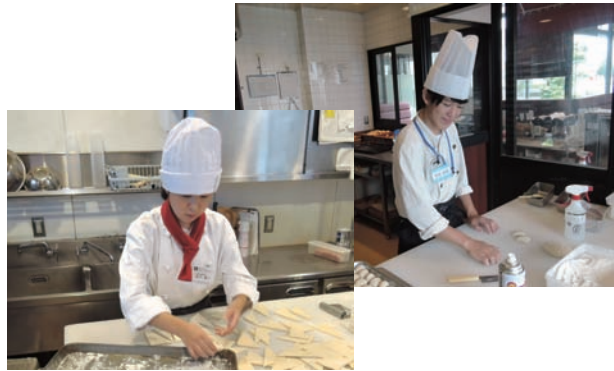
●奈良交通(株)・サンマルク学園前店、大和郡山店 ・奈良東、奈良西、高等養護学校生徒 (5人)