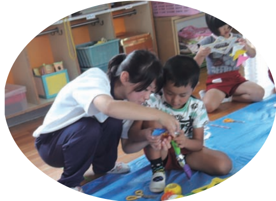
●斑鳩町立斑鳩東幼稚園 6/29~7/3 ・高等養護学校2年生 【実習】保育補助