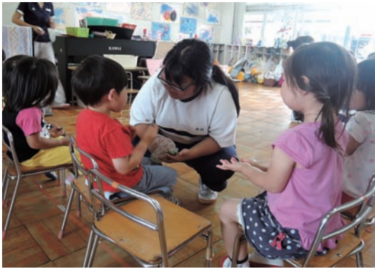
●三郷町立西部保育園 6/8~12 ・高等養護学校3年生 【実習】保育補助