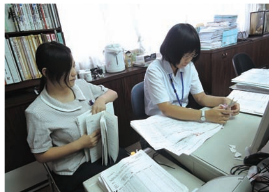
●済生会中和病院 6/29～7/3 ・高等養護学校2年生 【実習】事務補助