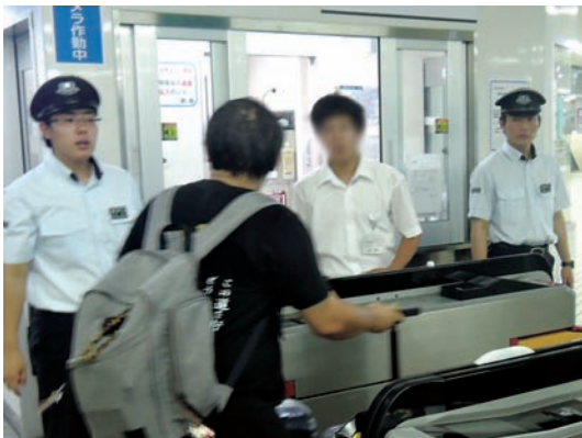
●近鉄奈良駅 8/24~26 ・奈良西養護学校2年生 【実習】改札補助