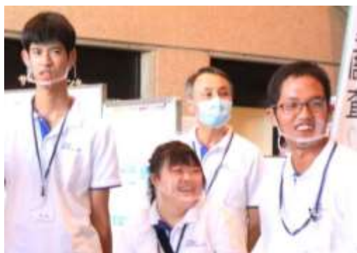
ならチャレンジド設立10周年記念事業(2020年8月)